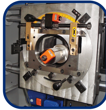
(GENİŞLİK-KALINLIK AYARI) (WIDTH-THICKNESS ADJUSTMENT)