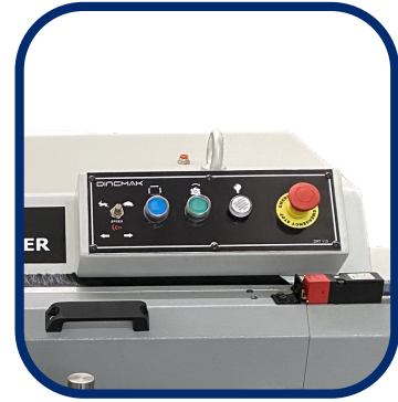
(KONTROL PANELİ / CONTROLLER)