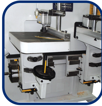
(YÜKSEKLİK-EĞİKLİK AYARI) (HEIGHT AND TILT ADJUSTMENT)